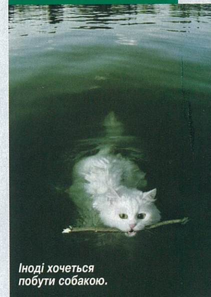
Іноді хочеться побути собакою.